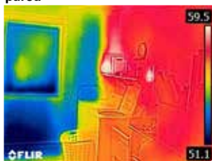
Pared exterior sin aislar