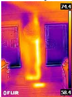
Tubo de drenaje caliente en la pared